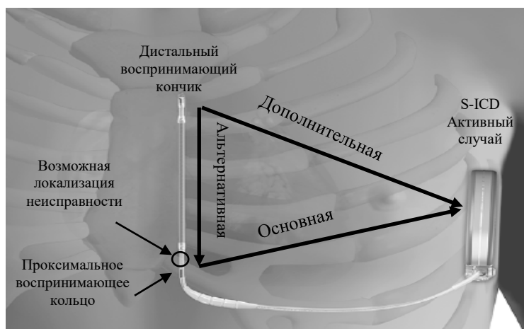
Рисунок 1. Система S-ICD in vivo , отображающая программируемые конфигурации восприятия и возможную локализацию неисправности.

Во время сборки подкожного электрода S-ICD EMBLEM небольшое количество адгезива наносится немного дистальнее проксимального воспринимающего кольца. Со временем механическое воздействие на тело электрода в этом месте может создать потенциальную возможность возникновения трещины, вызванной усталостью материала, со стороны внешнего просвета. Затем эта трещина распространяется внутрь к ориентированному по центру дистальному воспринимающему проводнику, что в конечном итоге приводит к перелому двух проводников высокого напряжения. На сегодняшний день компания Boston Scientific получила 27 сообщений о переломах тел электродов в этом месте; см. рисунок 1 для просмотра изображения системы S-ICD in vivo , обратите внимание на потенциальное место перелома в зависимости от программируемых конфигураций восприятия (то есть основного, дополнительного или альтернативного).